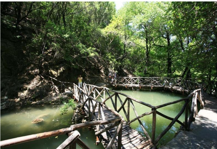
Vale das Borboletas