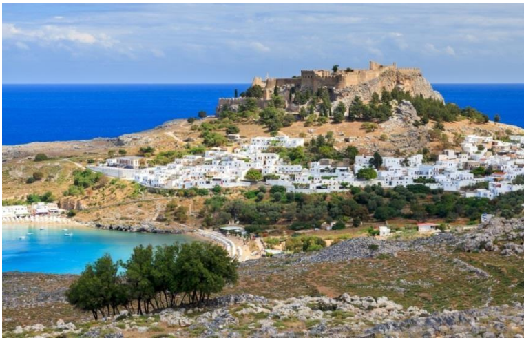
Acropole de Lindos