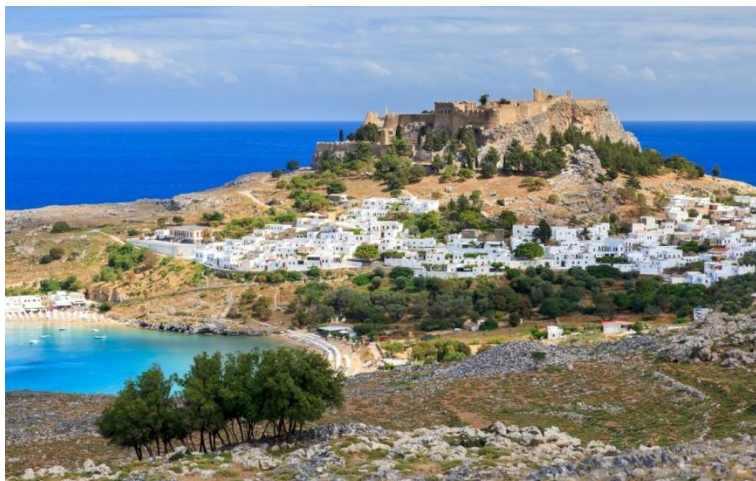
Acrópole de Lindos