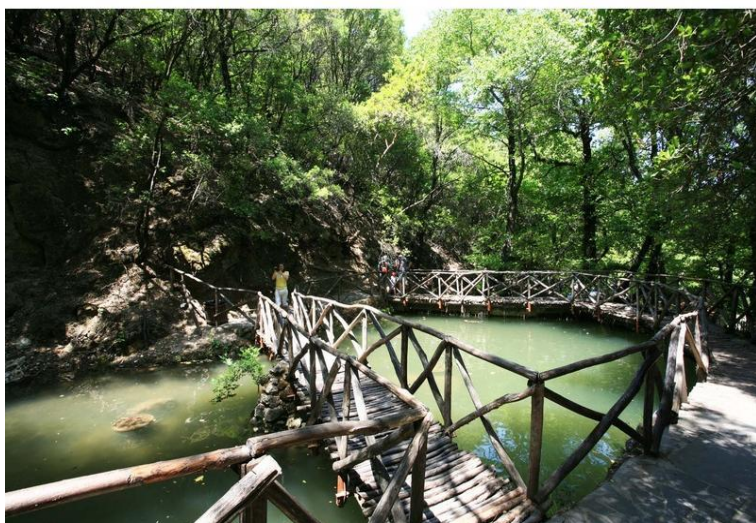
Vale das borboletas