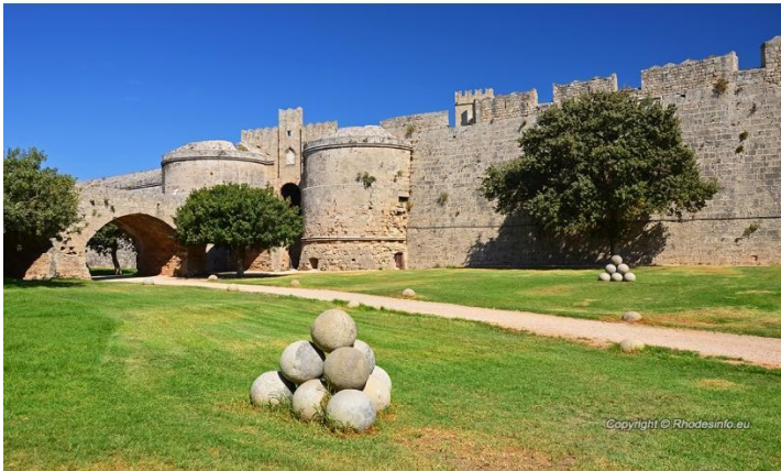
Castelo da cidade velha de Rhodos