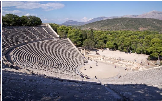
Antigo Teatro de Epidavros