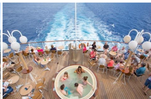
3 Dias de Cruzeiro em navio da Aegean Celestyal Cruises