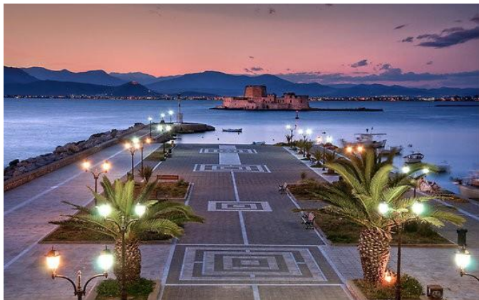
Nafplio - Bourtzi